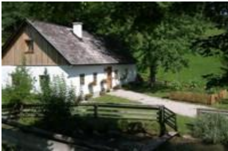
„Lenzau“ in Göstling

Genießen sie Ihre Urlaubstage in unserem neu reno-vierten Ferienhaus für 8 Personen. Heimelige Stube mit Kaminofen, Küche, 3 getrennte Schlafräume, Bad, WC. Stärken Sie sich in unserem eigenen Hausgarten. Beim Blick über unseren Fischteich erleben Sie lebendige Faszination!